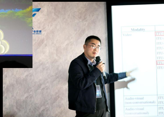
中国智慧家庭产业联盟 2017.12