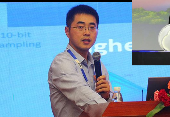
流媒体网长沙论道 2017.12