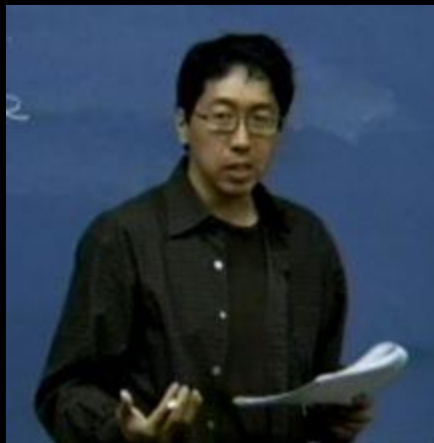
Andrew ng 吴恩达